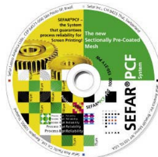
Beste Druckresultate mit SEFAR® PCF

An das werkseitig vorbeschichtete Gewebe werden zu Recht hohe Erwartungen gesetzt. Eine lückenlose Kontrolle erkennt beispielsweise jegliche Produktionsfehler. Mangelhafte Felder werden im Qualitätsbericht speziell markiert und selbstverständlich nicht verrechnet. Die Qualitätssicherung arbeitet nach der Norm ISO 9002, VDA 6.1